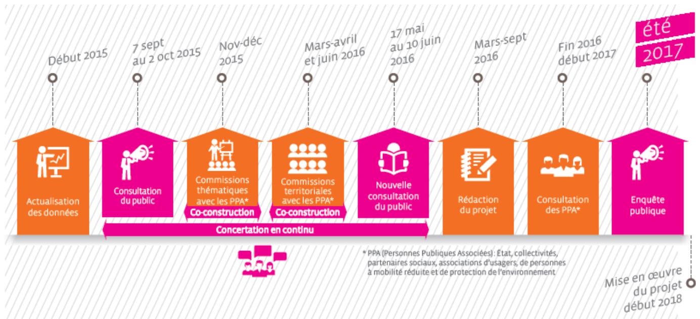
Calendrier du Projet Mobilités 2025 / 2030

Des stands Mobilités sont installés dans les stations terminus des lignes de métro ainsi qu'aux Arènes et Jean-Jaurès, deux stations pôles d'échanges. Jusqu'au 10 juin, les conseillers mobilités Tisséo vont à la rencontre des usagers pour expliquer et échanger à propos du projet et des questions de mobilité.